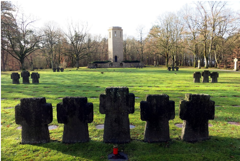
Der Ehrenfriedhof und die Kriegsgräberstätte Kolmeshöhe bei Bitburg (2015).