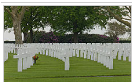
Gräberreihen im Halbbogen

Das Gebiet um Margraten bei Maastricht wurde am 13. September 1944 von Einheiten der 30th (US) Infantry Division erobert und befreit. Diese Einheiten gehörten zu den Truppen, die von hier aus in nordöstlicher Richtung nach Deutschland vorrückten. Am 10. November 1944 wurde durch die 9th (US) Army eben an dieser Stelle bei Margraten der erste und einzige amerikanische Soldatenfriedhof angelegt. Der Friedhof und das Ehrenmal wurden durch die Architekten Shepley, Bulfinch, Richardson und Abbott aus Boston in Massachusetts entworfen, die Arbeiten wurden 1960 beendet und am 7. Juli 1960 wurde diese Kriegsgräberstätte eingeweiht. Die Landschaft wurde von den