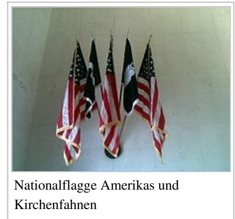
Nationalflagge Amerikas und Kirchenfahnen

An der linken Wand hängen drei US-Nationalflaggen und eine christliche und eine jüdische Kirchenfahne.