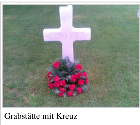
Grabstätte mit Kreuz

Die 8301 Grabsteine sind in parallelen Halbbögen angeordnet, der Davidstern weist auf die Gefallenen jüdischer Religion hin, während die übrigen Grabstätten mit christlichen Kreuzen versehen wurden. Die Kreuze sind aus Marmor und tragen den eingravierten Namen, den Dienstgrad, die Truppzugehörigkeit, den Bundesstaat und letztlich das Todesdatum.