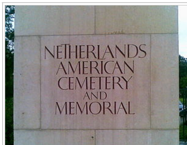
Einfahrt zum Soldatenfriedhof

(deutsch Niederländischer amerikanischer Soldatenfriedhof und Denkmal ) ist der einzige amerikanische Soldatenfriedhof im Königreich der Niederlande. Er liegt bei Margraten, ca. 15 km südöstlich von Maastricht an der N278, umfasst 26 Hektar und wird durch die American Battle Monuments Commission betreut.