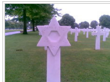
Grabstätte mit Davidstern