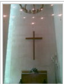
Innenraum der Kapelle

Im Inneren der Kapelle hängt ein vom niederländischen Volk gestifteter Kronleuchter, der die niederländische Krone darstellt. Die vom Dach herabhängenden kleinen Leuchten sollen das Firmament in Erinnerung rufen. An der Kopfseite steht ein aus Eichenholz geschnitzter Altar, die Gedenkschrift am Altar lautet: