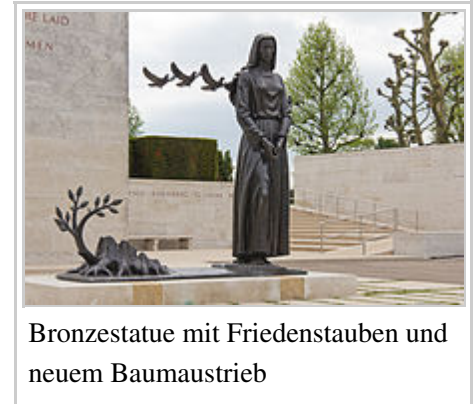
Bronzestatue mit Friedenstauben und neuem Baumaustrieb

IM GEDENKEN AN DIE TAPFERKEIT UND DEN OPFERN, DIE DIESE ERDE WEIHEN