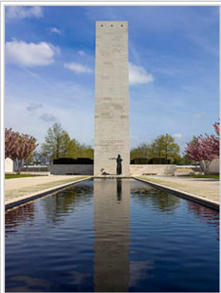
Vierecktturm und Kapelle

Außenwänden sind die größten Schlachtfelder aufgeführt, auf denen amerikanische Soldaten gefallen sind. Diese sind: Maastricht, Eindhoven, Grave, Nijmegen, Arnhem, Jülich, Linnich, Geilenkirchen, Krefeld, Venlo, Rheinberg, Köln, Wesel und Ruhrgebiet. Der Eingang zur Kapelle führt, von der Seite des Gräberfeldes, durch Bronzetüren, sie stellen den Umriss eines Lebensbaumes dar und tragen die Inschrift: